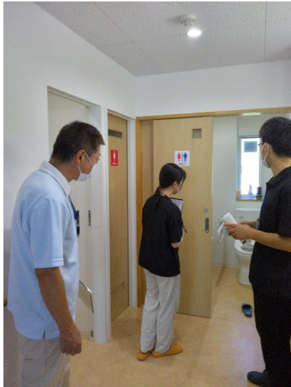
西おき第 1 ホーム