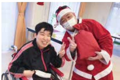
日中一時支援事業 (米沢市) 災害時における福祉避難所の指定 (米沢市)

山形新幹線の走る奥羽本線の沿線にあり、米沢市の南東部に位置しています。隣接施設として国立病院機構米沢病院・米沢市立第五中学校・ひばりが丘幼稚園があります。