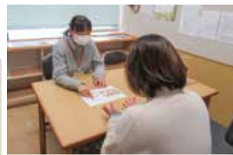
（相談支援事業所つるおか）

相談支援事業所つるおかでは、施設に入所する方や地域で生活を送る方、ご家族の相談を受けています。一人一人の気持ちに寄り添い、関係機関と連携し、その方が希望し、その方に合ったサービスを受けることができるようお手伝いしています。