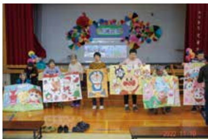
日中一時支援事業 (鶴岡市、酒田市、遊佐町、庄内町) 災害時における福祉避難所の指定 (遊佐町)

国道7号線から高台に入ると、閑静な松林の中に吹浦荘が現れます。その真後ろにそびえ立つ鳥海山は正に息をのむ雄大さです。現地に移転して30年近くになりますが、開所時は吹浦の海岸線近くにあったことで吹浦荘という名称になりました。