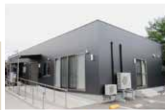
（慈丘園共同生活事業所）

慈丘園は利用者みなさんの意思を尊重しながら、健康で元気に、楽しく生活を送ることができるよう努めています。